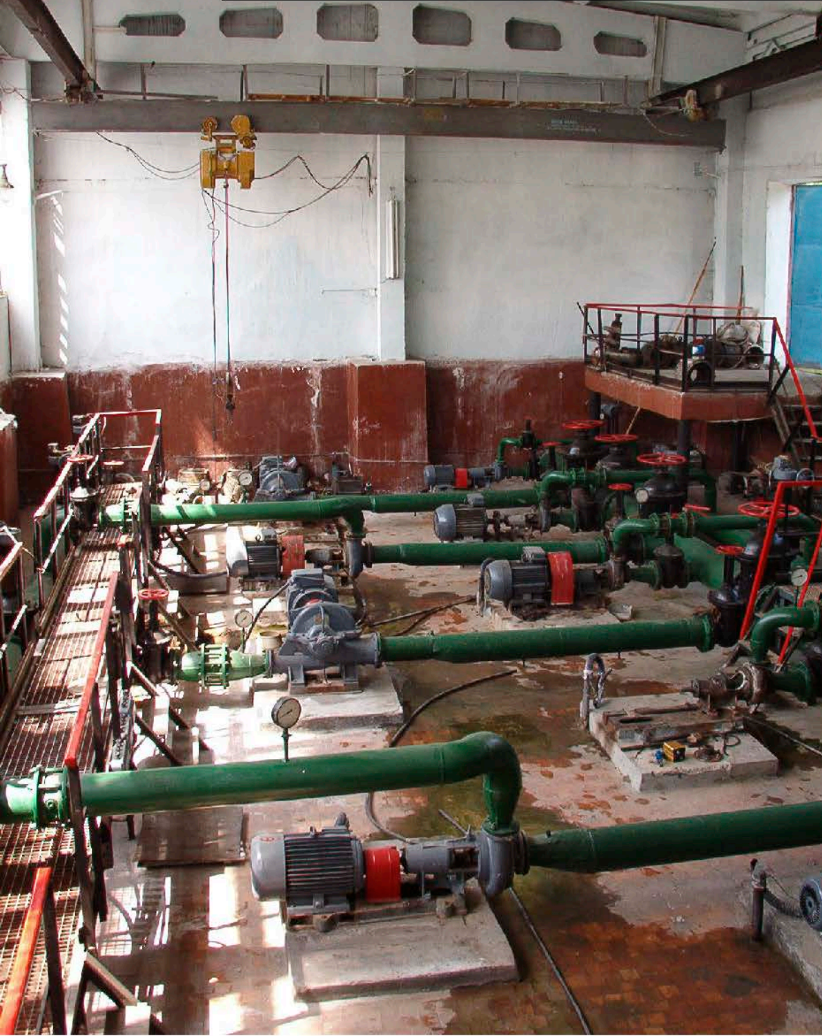
г. Кахул, Насосная станция «НС №3» до модернизации