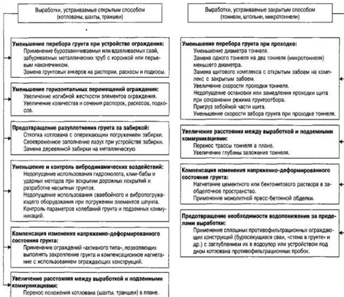
Рисунок 2.2 – Блок-схема технологических мер защиты подземных коммуникаций

Технологические меры (см. рис. 2.2) - уменьшение изменения напряженно-деформированного состояния подземных коммуникаций и грунтового массива обеспечивается за счет применения особых технологий, техники и конструктивно-технологических решений, которые используются непосредственно в процессе выполнения основных строительных работ. Технологические меры применяются в пределах зоны строительства и служат в первую очередь для снижения и компенсации технологических негативных воздействий строительства на существующие подземные коммуникации.