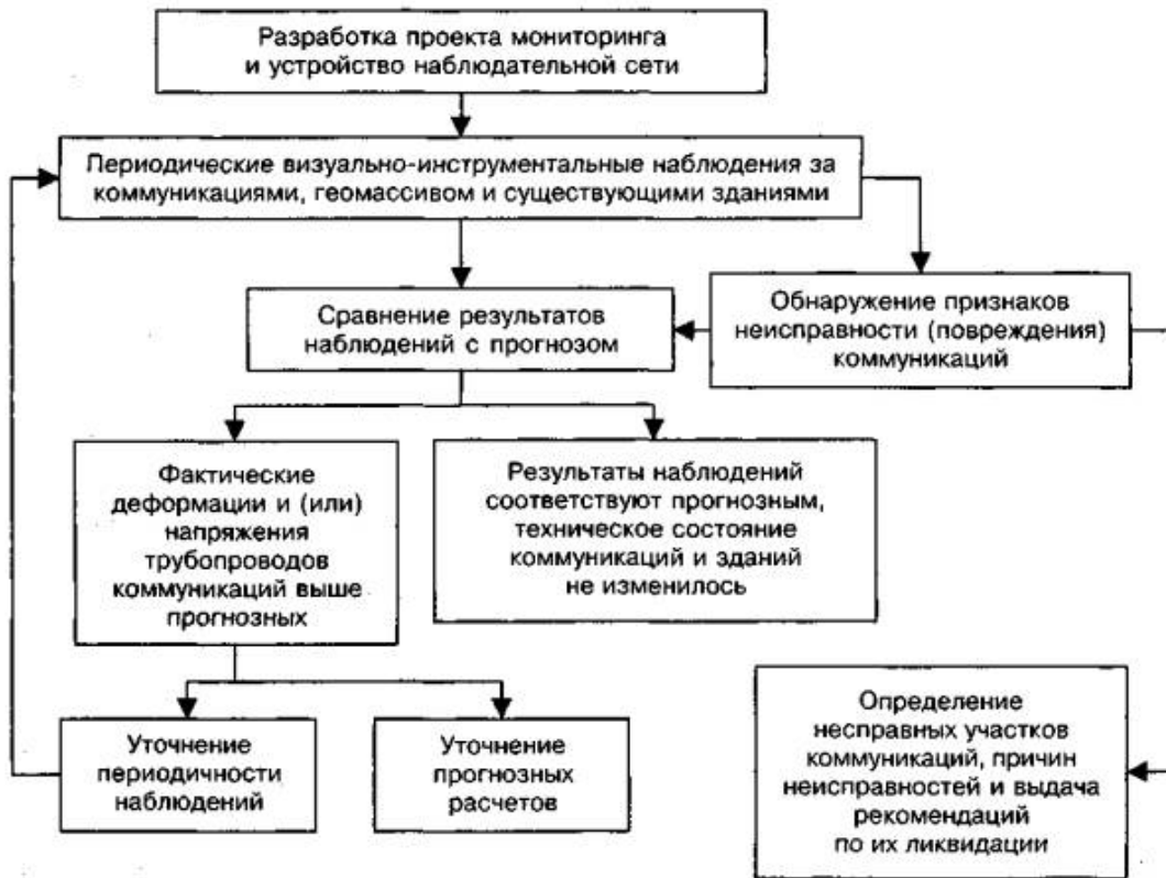
Рисунок 3.1 - Блок-схема мониторинга подземных коммуникаций на стадии строительства

Система обеспечения сохранности подземных коммуникаций для стадии строительства представлена в виде блок-схемы на рис. 3.1.