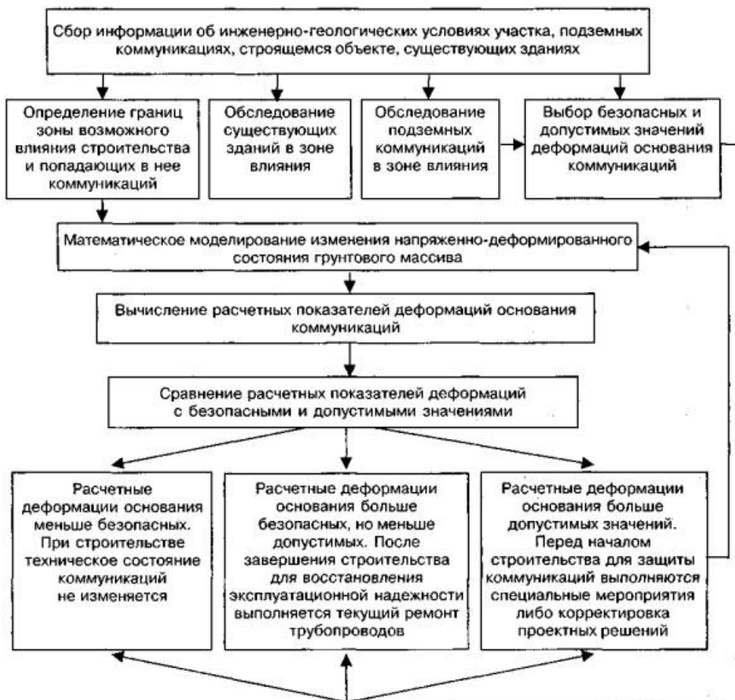
Рисунок 2.1 - Блок-схема системы обеспечения сохранности подземных коммуникаций на стадии проектирования объекта